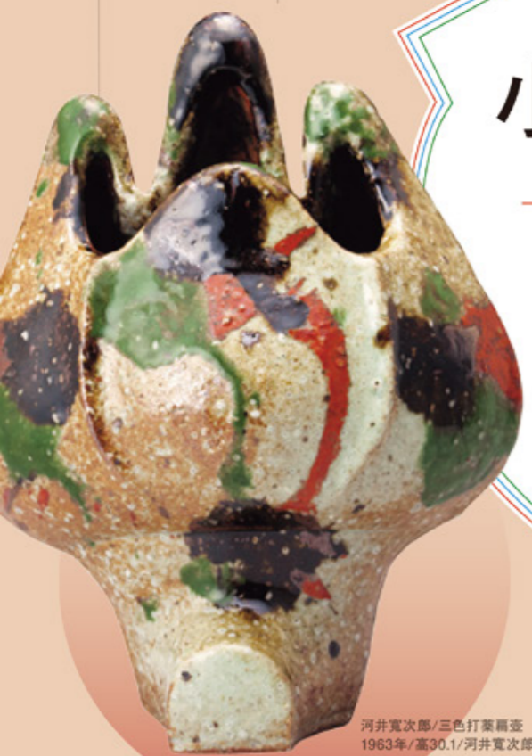
河井寛次郎/三色打葉罌壺 1963年/高30.1/河井寛次郎記念館蔵