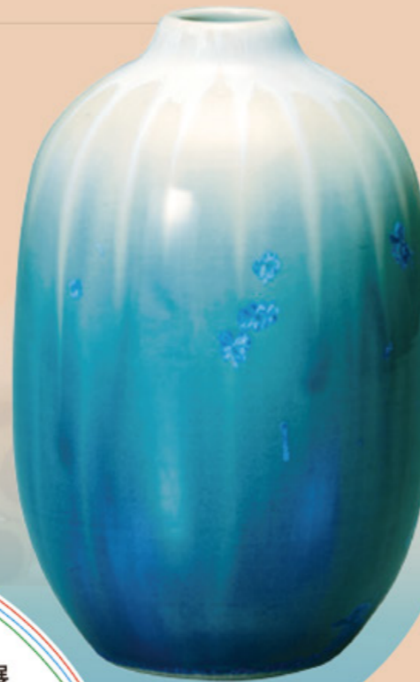
小森忍/藍青寶石繪壺 1951-62年/高20.5/江別市蔵