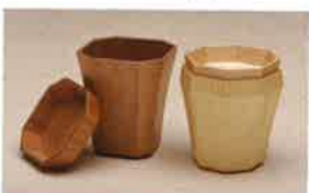
〔審査員賞〕小口 富雄/四方彫切り八角清流