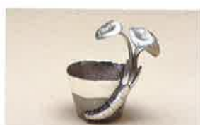
〔第5回記念賞〕岡澤 治季/銀装そば猪口 和咲映