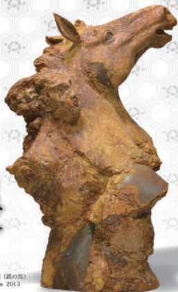
魚谷政代司 (政の馬) 高 130.0cm 2013