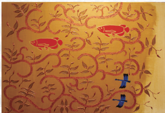
キム・ソング (紅魚-healing) 34.0×83.0cm 2013