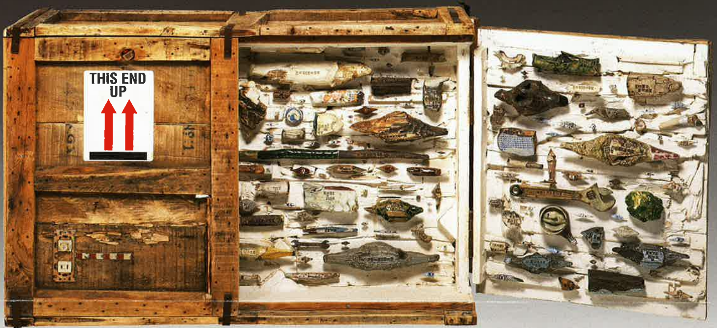
戸田守宣 「THIS END UP 0209」