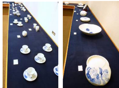
↑ 研修生作品展のようす (瀬戸市文化センターにて)

↓ 研修生作品展のようす (瀬戸蔵 セトもの祭会場にて) (瀬戸染付工芸館 本館2階にて)