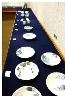
↑ 研修生作品展のようす (瀬戸市文化センターにて)