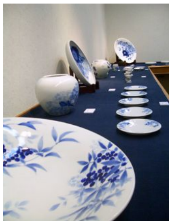
↑ 研修生作品展のようす (瀬戸市文化センターにて)