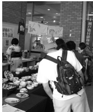
研修生作品展のようす (瀬戸蔵 せともの祭会場にて)