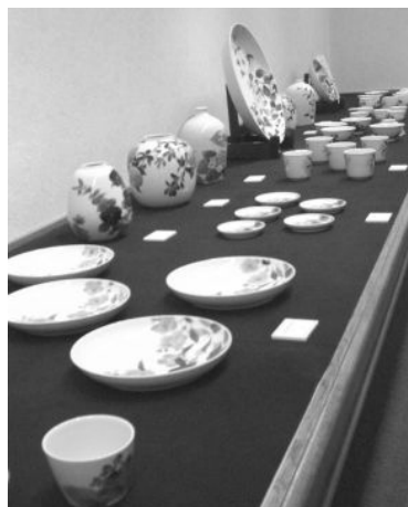
研修生作品展のようす (瀬戸市文化センターにて)