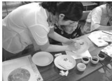
瀬戸染付体験事業のようす (マルチメディア伝承工芸館本館2階にて)