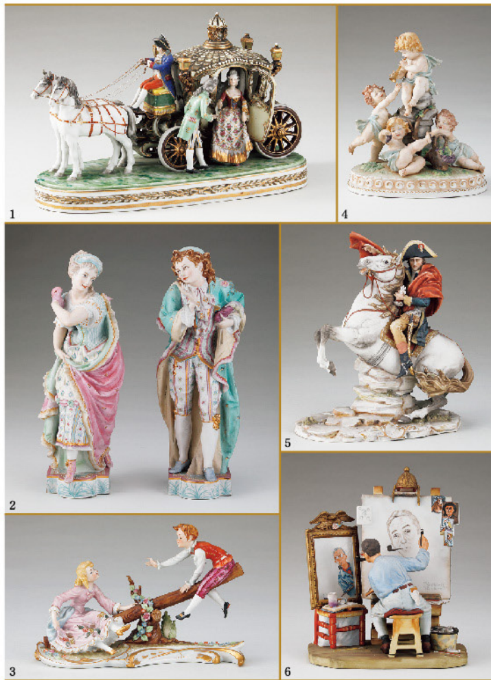
上部背景：丸山陶器社屋全景写真 1960(昭和35)年頃 1.《二頭立馬車》1947~1952(昭和22~27)年 幅34.1cm 2.《マスクを持つ男女》1950(昭和25)年 高さ(右)46.2cm 3.《ソーラー乗り少年少女》1958(昭和33)年 幅25.8cm 4.《戯れるエンゼル》1962(昭和37)年 高さ23.8cm 5.《アルプス越えのナポレオン》1967(昭和42)年 高さ32.6cm 6.《自画像》1978(昭和53)年 幅22.8cm (ノーマンロックウェル原画・サタデーエニングポスト1960.2.13表紙) ※作品は全て丸山陶器株式会社蔵

本展は、瀬戸ノベルティを代表するメーカーである丸山陶器が製作した代表的なノベルティを一堂に展示する初めての展覧会です。丸山ノベルティの技や美の世界とともに、その歴史などをご観いただくことで、世界で愛された瀬戸ノベルティについてご理解を深めていただく機会の一助となればと考えています。