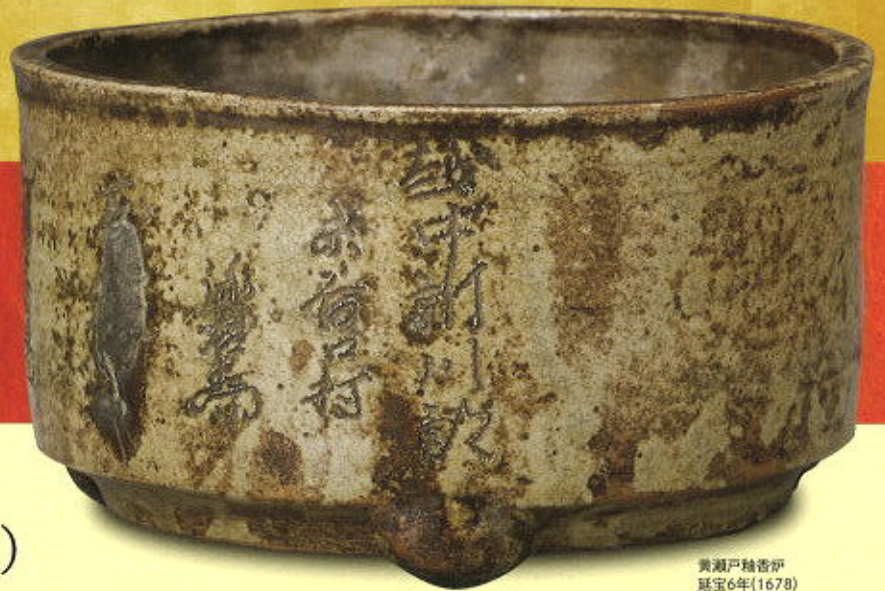
黄瀬戸釉香炉 延宝6年(1678) 口径18.5cm 蓮王寺蔵 富山県指定文化財