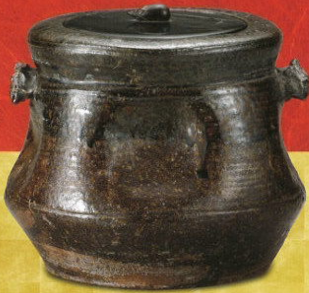
鉄胎写付水櫃 17世紀 胴径20.8cm 個人蔵