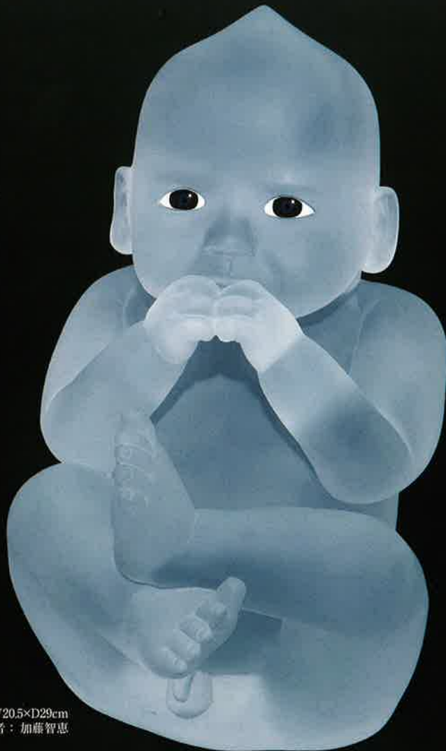
「山頭赤子座像」ガラス H34×W20.5×D29cm 2016年

開館時間▼午前10時～午後6時(入館は5時30分まで) 休館日▼毎週火曜日(祝日の場合は翌平日) 入館料▼無料 主催▼瀬戸市新世紀工芸館、公益財団法人瀬戸市文化振興財団