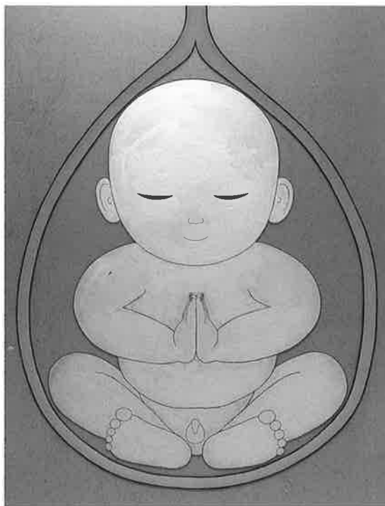
「おなかの中シリーズ、念仏」67.7×52.3cm 2015年