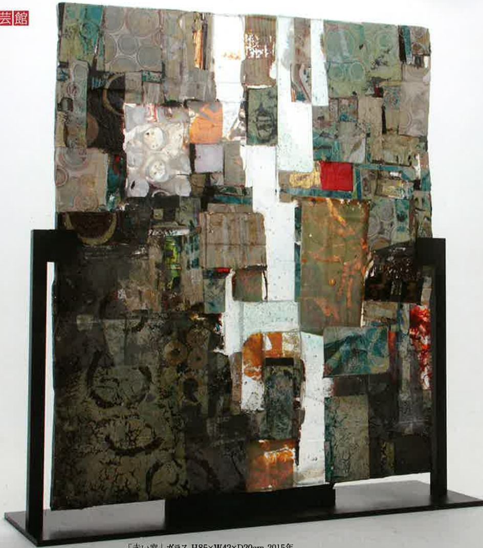
「赤い心」ガラス H85×W42×D20cm 2015年